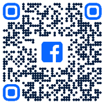
本校 Facebook 專頁

如欲了解更多本校資訊，歡迎瀏覽學校網頁 www.lstlkkc.edu.hk 。另外，本校已於 Facebook https://www.facebook.com/share/5sNkFBD4mr3q2tw9/?mibextid=LQQJ4d 及 Instagram https://www.instagram.com/lok_sin_tong_lkkc?igsh=MTc3ZHh0b3FpOG45MQ== 社交平台設立官方專頁，讓大家瀏覽本校最新資訊及消息，或可掃描下方二維碼瀏覽有關資訊。