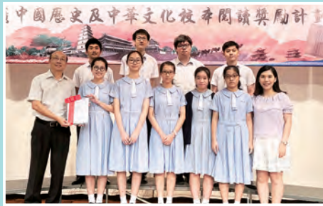
推廣中國歷史及中華文化校本閱讀獎勵計劃