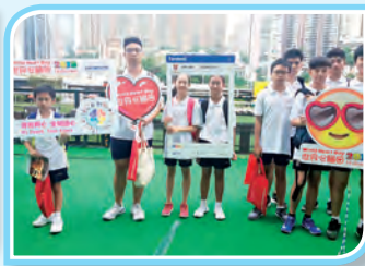
世界心臟日跳繩隊表演