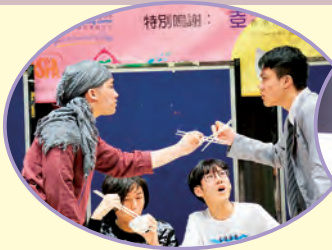
「阿爸、阿媽，食飯喇！」校際戲劇比賽