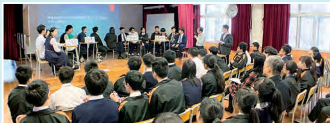
班際基本法問答比賽決賽