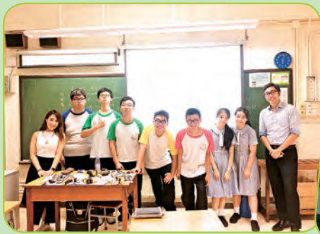
校園用電審計大使