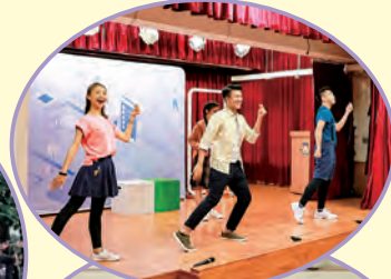
香港藝術節青少年之友