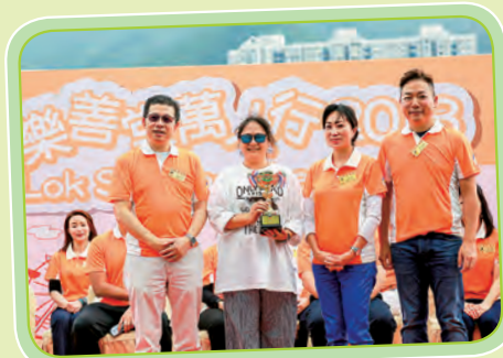
萬人行 2018 中學組最高籌款獎冠軍