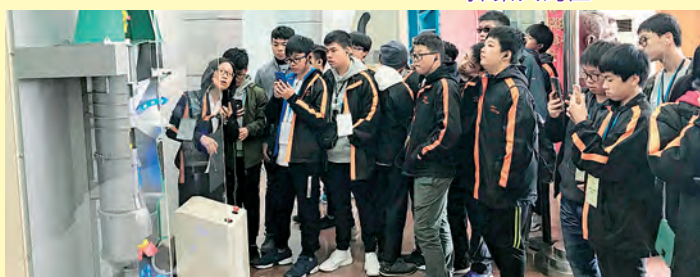
東莞市科學技術博物館參觀