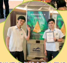
香港環境卓越大獎中學組優異獎