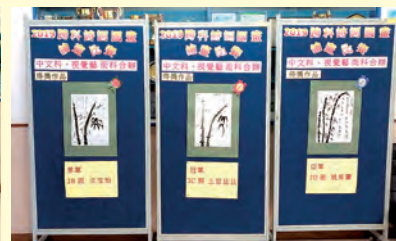
中文科視藝科合辦詩詞繪畫比賽