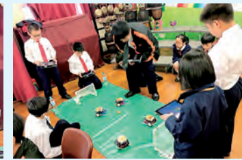
李陞小學 STEM 主題學習日支援活動