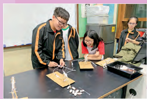
中一 液壓起重機製作工作坊

為加強跨學科協作學習活動，各跨學科教育學習領域為各級學生舉辦不同類型學習活動，包括科學教育學習領域的液壓起重機製作、科技教育學習領域的 STEM 體驗工作坊、個人、社會及人文教育學習領域的中西區文物徑考察參觀、藝術教育學習領域的參觀香港文化博物館及生涯規劃教育組的 Career Live 體驗，學生透過參與活動，融合平日課堂所學，增廣知識。