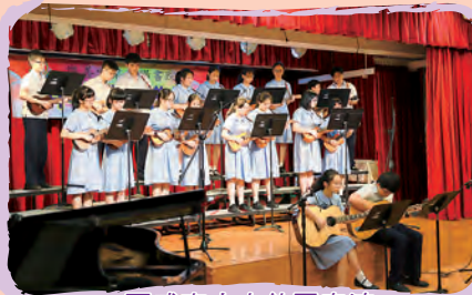
夏威夷小吉他團表演