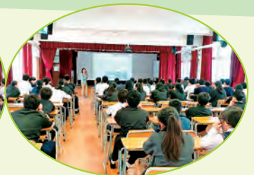
中二惜物惜食講座