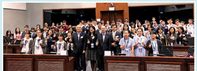
「青teen講場2018」模擬立法會辯論比賽