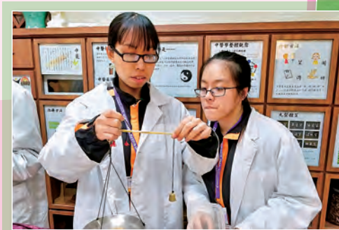
中五 Career Live 職場體驗