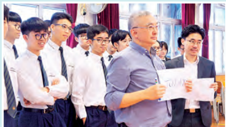
Let's Make an EcoPledge