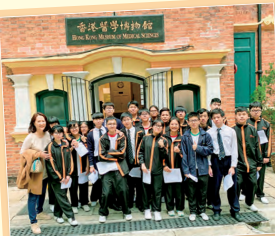
中三 上環文物徑考察遊