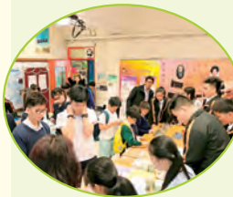
微型開放日環保攤位