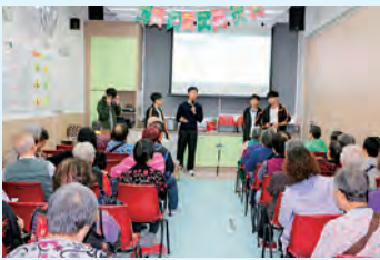
長者中心科技產品介紹