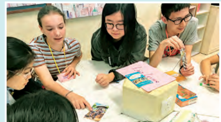
mini English fun day