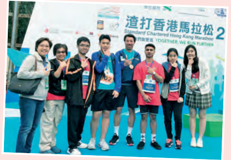
渣馬領袖盃義工服務