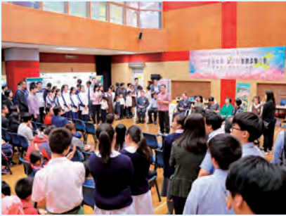
以 STEM 教育連繫小島