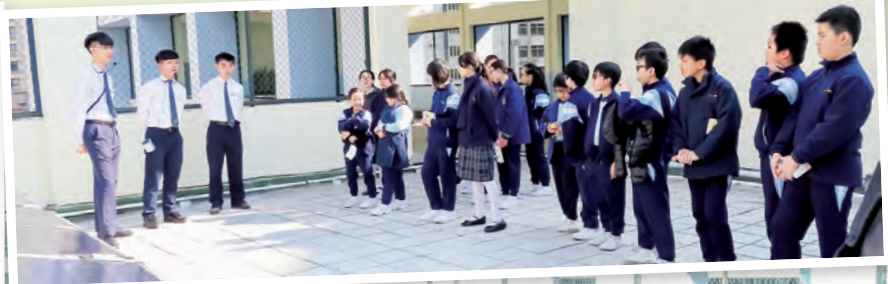
學生介紹太陽能光伏板的運作