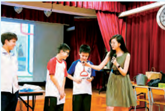
MTR STEM 創未來講座