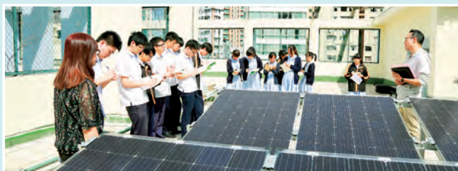
太陽能板教學活動