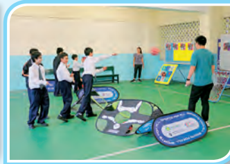
新動校園運動體驗計劃「巧固球」