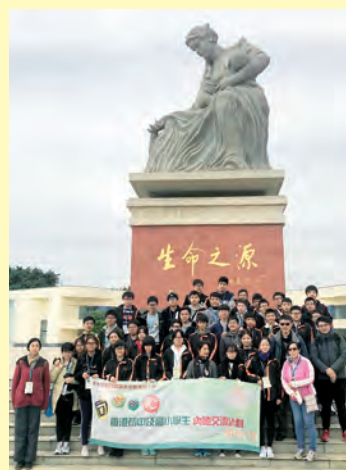
東深供水工程生命之源石像前留影