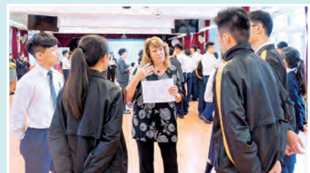
Let's Make an EcoPledge