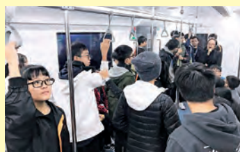
東莞市科學技術博物館模擬地下鐵逃生