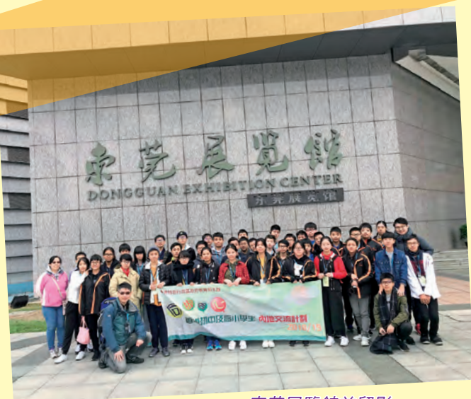
東莞展覽館前留影

同學們參觀了東深供水工程、港資科技企業、松山湖科技產業園區、東莞展覽館、東莞市政廣場、東莞圖書館、國際會展中心、東莞大道，及東莞市科學技術博物館等建設。過程中，他們認真投入參觀導賞，獲益良多。