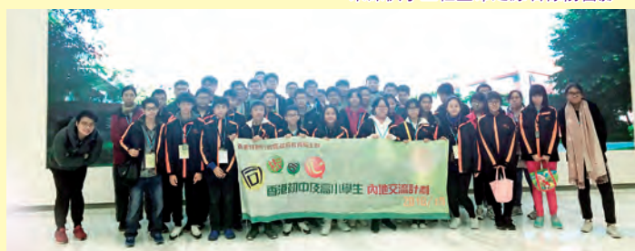
松山湖科技產業園區留影