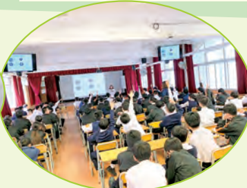
中一海洋垃圾及無飲管講座