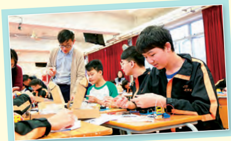
中二 摩斯密碼電報機