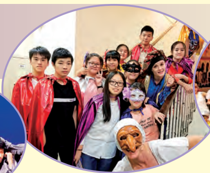
「2018 樂·誼國際音樂節——兒童音樂會：馬可孛羅重遊威尼斯嘉年華」