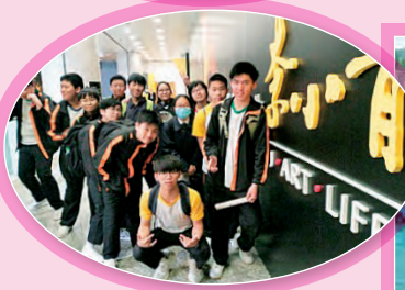
中四 參觀香港文化博物館