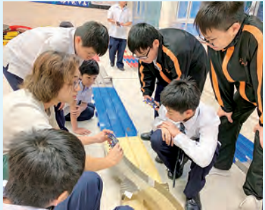
迷你四驅車訓練班

學生除了在學校內進行活動外，更有機會接觸社區，參與多項社區服務，如到區內小學分享 STEM 活動，到長洲參與「以 STEM 教育連繫小島」活動，介紹學生的創新作品。我校本年度參與了社聯舉辦的「樂齡科技顯愛心」2018、九龍樂善堂舉辦的「關懷弱勢社群——全港創新科技設計大賽」、STEM《未來百貨公司》道具設計大招募、Samsung Solve for Tomorrow 2018、由香港電燈公司舉辦的「綠色能源夢成真 2019」等多個比賽，讓學生了解及關注社區及弱勢社群並能回饋社會。