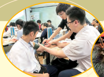
大專院校課程體驗

本年在中一及中三級推行校本生涯規劃課程，從初中開始掌握生涯規劃的概念，認識個人特質及能力，掌握社會發展趨勢及升學要求，為生涯管理及早準備。高中學生透過多元活動體驗由學校過渡至職場的世界，尋找個人夢想及探索發展方向。