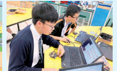
Micro: bit 工作坊