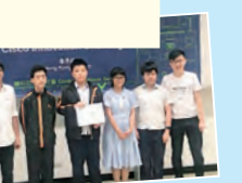
「思科創意解難挑戰賽」創意獎