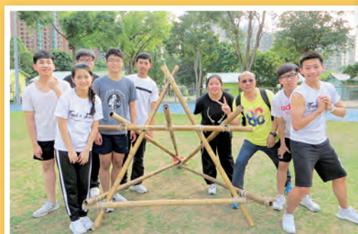
透過歷奇活動，訓練同學的合作性及溝通技巧