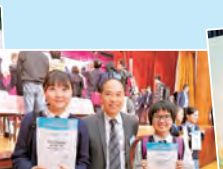
香港島傑出學生選舉