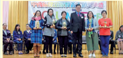
家長教師會燒烤活動