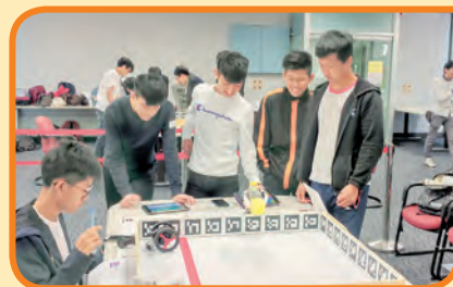
全港中小學生 STEM 機械人大賽 2018