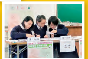
星島第三十三屆全港校際辯論比賽