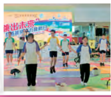
「跳出未來」慈善跳繩接力挑戰日