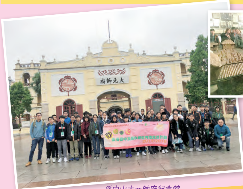
孫中山大元帥府紀念館