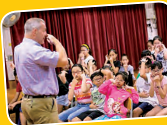
English Day Camp