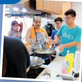
南亞裔社區共融活動