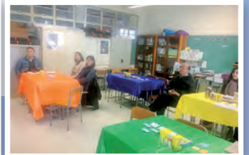
性格透視 OR 教師工作坊，讓高中班主任掌握生涯規劃工具