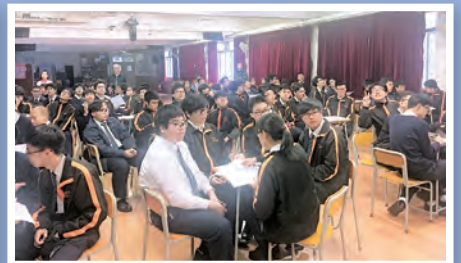
中四生涯規劃工作坊「RIASEC 與職業聯想」