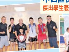
全港中學大專學生泰拳錦標賽