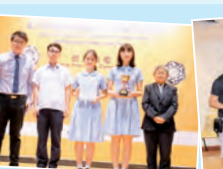
第六屆校際香港歷史文化專題研習比賽高級組季軍