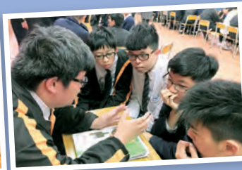
學長分享會上高中學長努力向中三師弟师妹介紹自己修讀學科