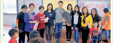
本會參與家長也敬師活動 家長會員參與「環保科技在我家」攤位遊戲 家長義工協助本校中一新生面試日接待