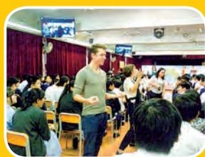
Swiss Family Robison by Absolutely Fabulous Theatre