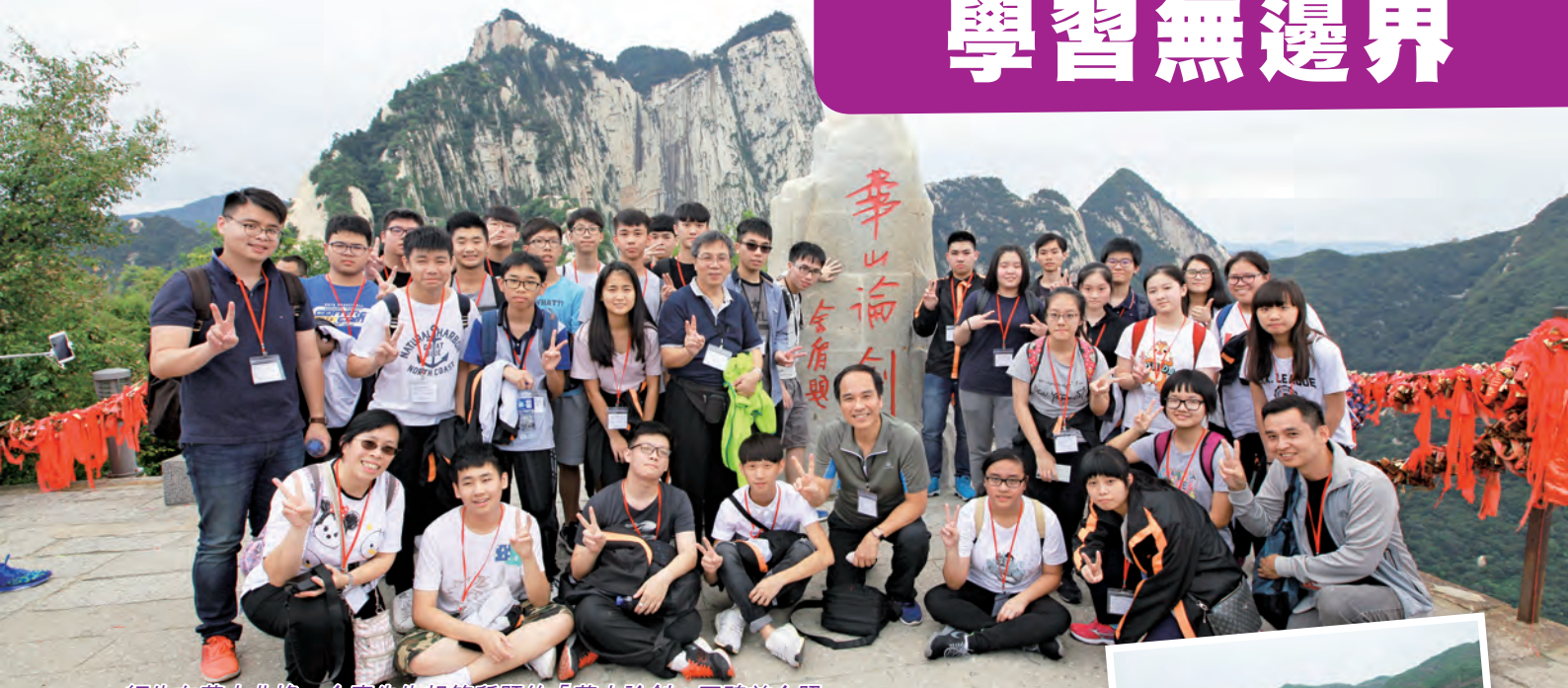
師生在華山北峰，金庸先生親筆所題的「華山論劍」石碑前合照

「香港百人學生『一帶一路』研習交流團（六）華山論劍」，由東海（企業）國際有限公司主辦，陝西省海外聯誼會協辦，在 2017 年 9 月 6 日至 10 日考察了古都西安，期間參訪了兵馬俑、明代長安古城牆、半坡博物館、司馬遷墓、軒轅廟、小雁塔和西安博物館，登華山，觀賞壺口瀑布等名勝古蹟，亦會與西安交通大學附屬中學進行探訪交流，參觀西安交通大學 3D 列印實驗室、工程坊等項目，進行學術性交流及考察。交流團讓中港兩地同學建立聯繫，並讓學生親身認識古都歷史文化及最新國情，培育其民族自豪感以及建設祖國和香港的使命感。