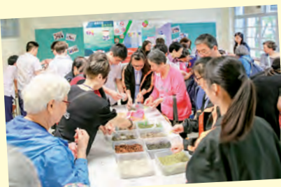
環保科技嘉年華之環保工作坊