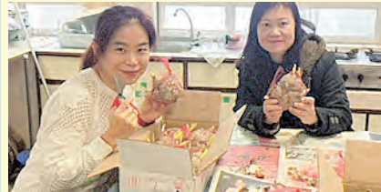
家長會員參與「想創前途」家長講座