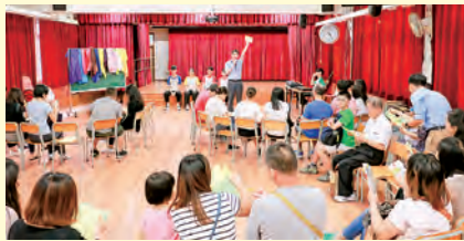
家長義工、學生義工及老師參與 「2017 耆愛 @ 月餅」活動