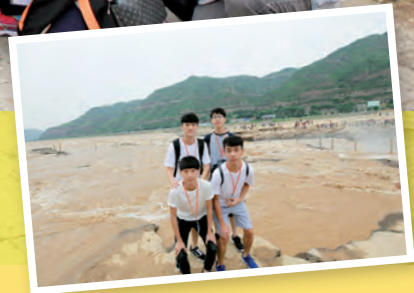
學生觀賞黃河壺口瀑布之壯麗景色

「香港百人學生『一帶一路』研習交流團（六）華山論劍」，由東海（企業）國際有限公司主辦，陝西省海外聯誼會協辦，在 2017 年 9 月 6 日至 10 日考察了古都西安，期間參訪了兵馬俑、明代長安古城牆、半坡博物館、司馬遷墓、軒轅廟、小雁塔和西安博物館，登華山，觀賞壺口瀑布等名勝古蹟，亦會與西安交通大學附屬中學進行探訪交流，參觀西安交通大學 3D 列印實驗室、工程坊等項目，進行學術性交流及考察。交流團讓中港兩地同學建立聯繫，並讓學生親身認識古都歷史文化及最新國情，培育其民族自豪感以及建設祖國和香港的使命感。