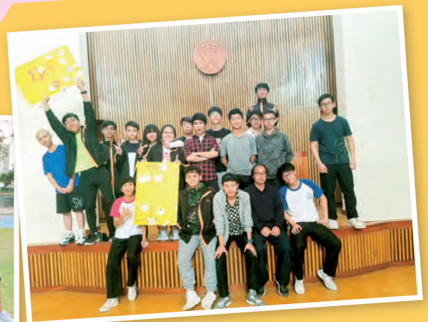
訂立團隊口號，加強組員之間的凝聚力