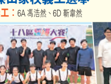
十八區跳繩比賽優異獎