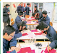
中文學會「賀年揮春齊齊寫」