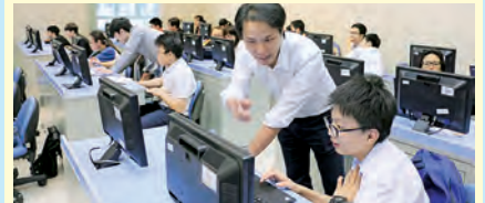
家教會委員出席本校中六畢業典禮並由主席頒發家教會獎學金 家長委員出席舞蹈示範