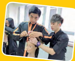
職業體驗：「職」出前路