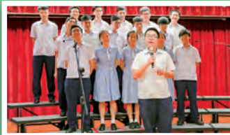
高中班際音樂比賽