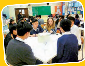
Oral Practice with South Island School