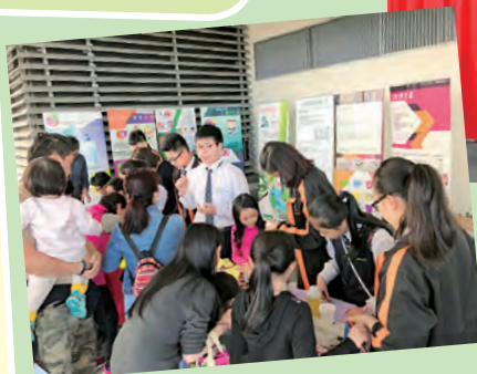
環保周之社區公園環保攤位