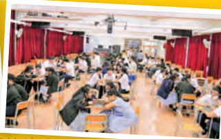
學術常識問答比賽