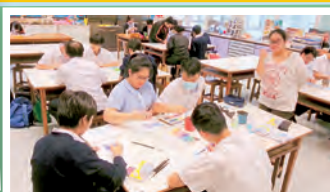
導師指導同學水彩畫