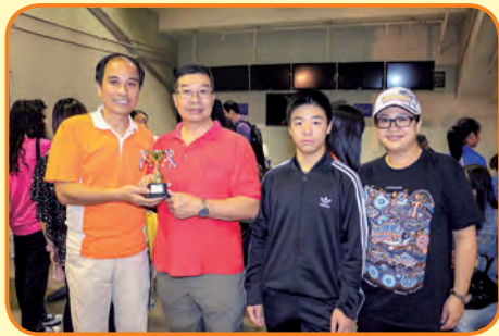
萬人行個人最高籌款獎冠軍