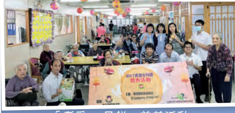
「耆愛@月餅」慈善活動