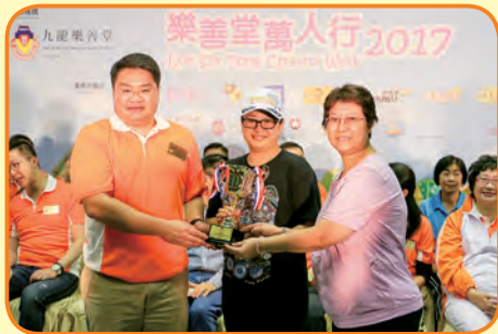
萬人行中學組最高籌款獎冠軍