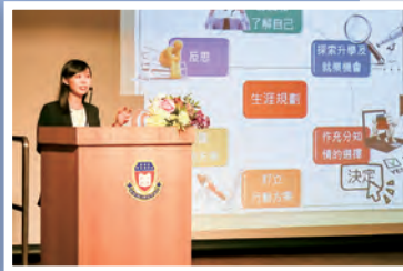
青少年服務處社工主持家長講座，分別為「家長如何協助子女進行生涯規劃」及「家長如何協助子女高中選科」