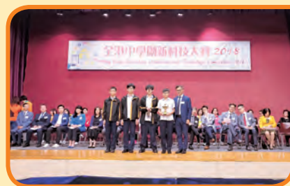
全港中學創新科技大賽 2018