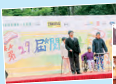
第 29 屆閱讀嘉年華話劇比賽