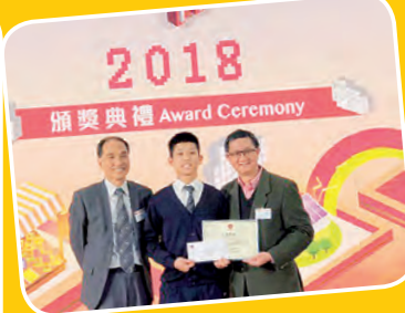
「學校起動計劃」頒獎典禮