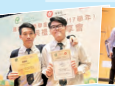
羅氏應用學習獎學金