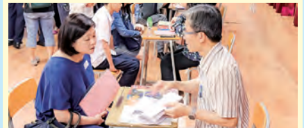
家教會主辦電腦親子課程：「認識光敏技術——自製個性化人像簽名圖章」工作坊