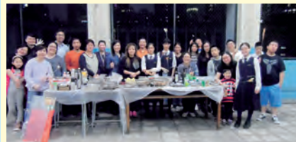
第三次正念重聚活動