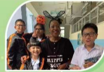
English Halloween Trick or Treat