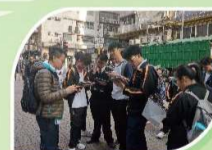
參觀市區重建實地考察