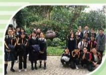
中文史科參觀茶具博物館