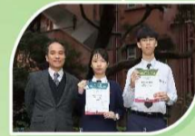
香港島傑出學生選舉