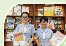
第44屆全港青年學藝比賽普通話演講中學組季軍