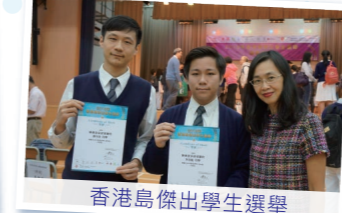
香港島傑出學生選舉