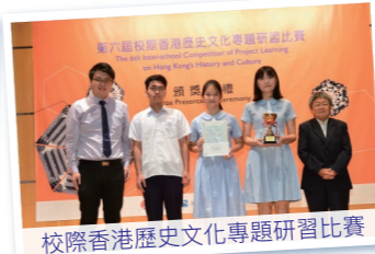
校際香港歷史文化專題研習比賽