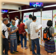
選科及升學輔導諮詢