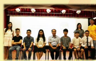
第八屆校友會選舉