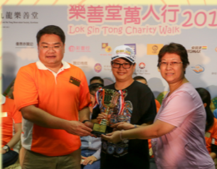
「九龍樂善堂」萬人行2017 中學組單位最高籌款獎冠軍