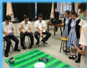
STEM教育結合科技與生活