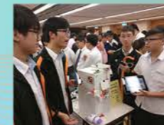
全港中學創新科技大賽2018