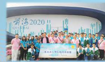
陽光學子計劃 - 粵港澳大灣區機遇考察團