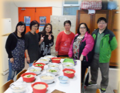
家教會新春年糕製作班