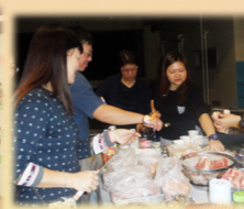
家長教師會燒烤活動