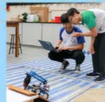
第二屆機械人大決戰 - 六足機械人