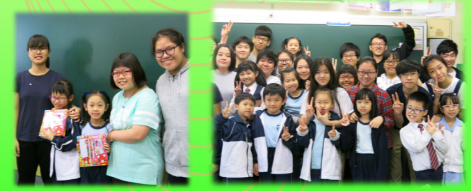
Reading to Learn, Learning to Serve