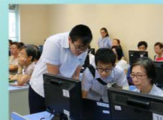
科技環保在我家 長者3D繪圖工作坊