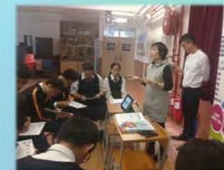
升學講座及面試技巧