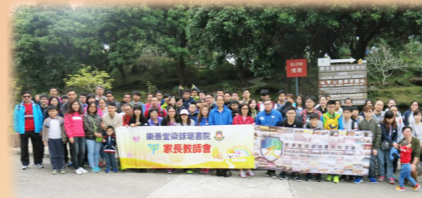
家長教師會與校友會合辦師生樂悠遊