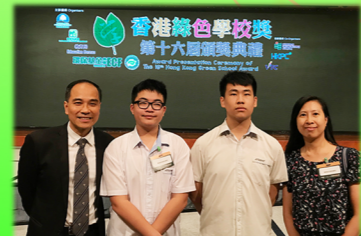
榮獲第十六屆香港綠色學校金獎