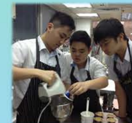
行業參觀-西式食品