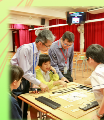
小學魔力橋數學棋邀請賽