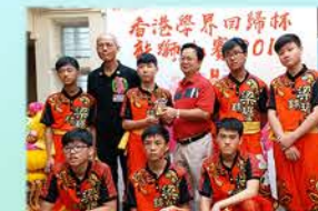
香港學界回歸盃龍獅比賽2018 優異獎