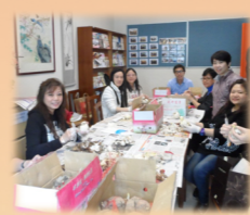
家長新春水仙培植班