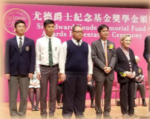
2017-18尤德爵士紀念基金 高中學生獎