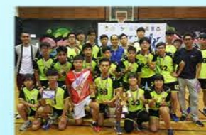
「跳出未來」慈善跳繩接力挑戰日