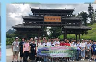
「同根同心」廣西南寧和 德天的文化及地貌探索之旅