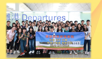
台灣地理通識升學考察之旅