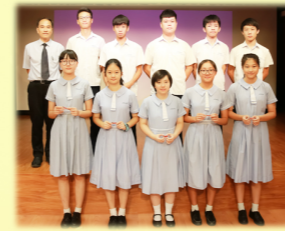
領袖生授憑暨授章典禮