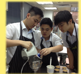
行業參觀-西式食品