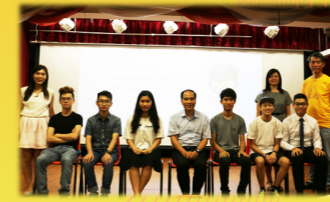
第八屆校友會選舉