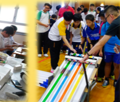
全港學界迷你四驅車大賽