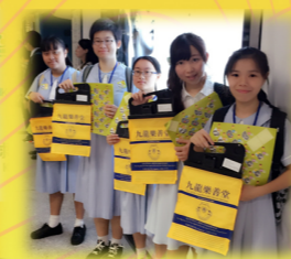
「九龍樂善堂」售旗日