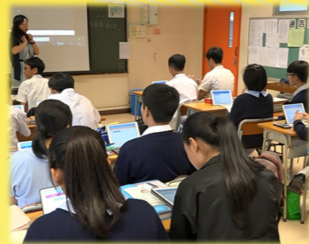
運用電子學習平台進行課堂活動