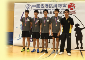
跳繩隊在全港跳繩分齡比賽中 獲取多個獎項