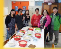
家教會新春年糕製作班