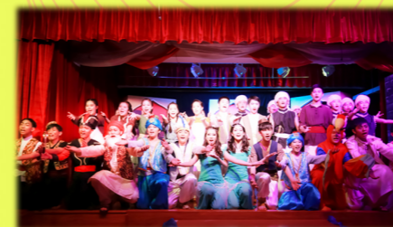
English Musical - Aladdin—Prince of Thieves