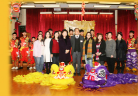
中西區家長教師會聯會 新春交流會