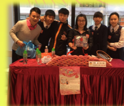
「甜心行動」學生義工