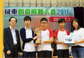
全港STEM機械車 創意解難大賽2016冠軍