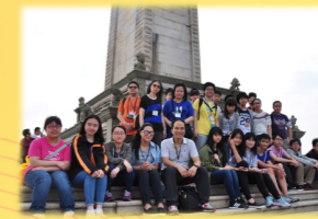
「一帶一路」西安學習之旅增廣見聞