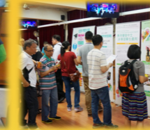
選科及升學輔導諮詢