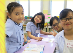
Reading to Learn, Learning to Serve