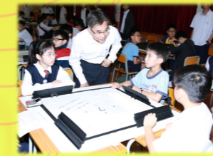
魔力橋數學棋邀請賽