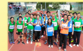
銀禧田徑運動會-火炬接力跑