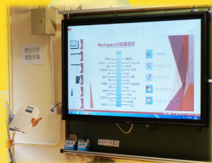
本校中一班房內安裝了觸控電子教學屏幕