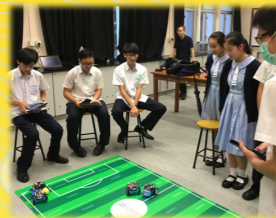
STEM教育結合科技與生活