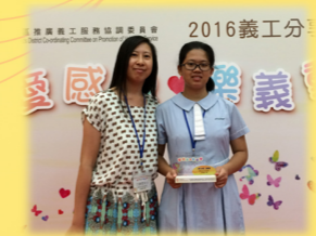
傑出義工團體嘉許獎