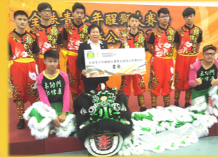
全港青少年醒獅大賽 中學組 - 亞軍