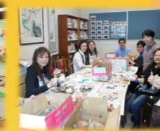
家長新春水仙培植班