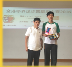
全港學界迷你四驅車大賽 中學組 - 季軍