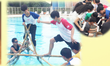
「初中班長培訓計劃」領袖訓練日營