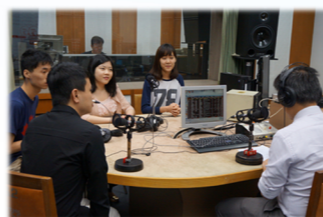
學生參與電台節目 分享讀書心得