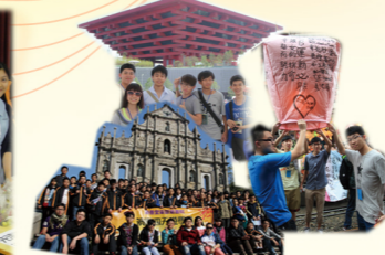
參加不同地方的交流團增廣見聞