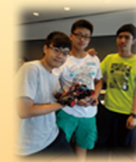
創新資訊科技嘉年華