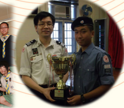
紅十字隊青年團獲最佳進步團隊 (西區杯)