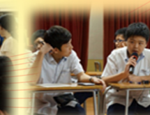
學科常識問答比賽