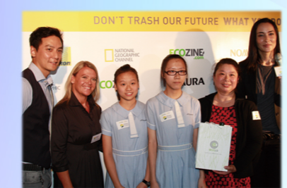
Hong Kong Country Cleanup Challenge Gold Award