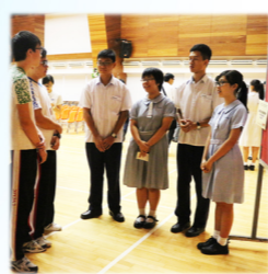
其他學習經歷設計者計劃 低碳生活匯報