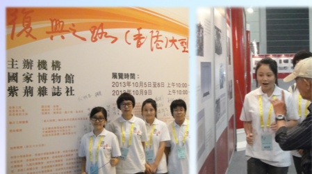
「中國夢·復興之路(香港)大型展覽」學生導賞員