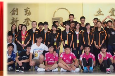
同根同心」香港初中及高小學生內地交流計劃 - 潮州的歷史文化