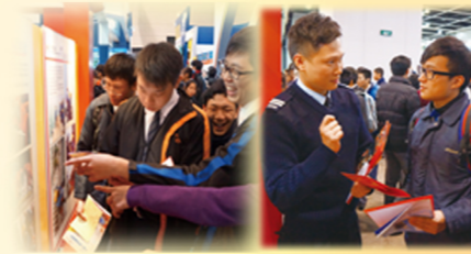
中六學生參觀升學就業博覽