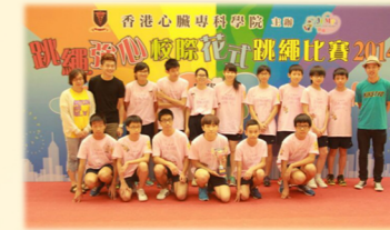
跳繩隊在校際花式跳繩比賽中獲中學甲組優異獎