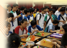
初中數學攤位遊戲