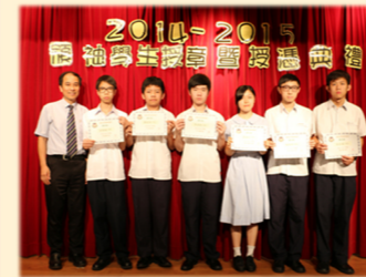
領袖學生授憑暨授章典禮