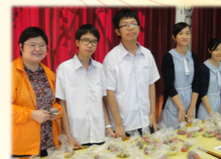
科學週水果義賣活動