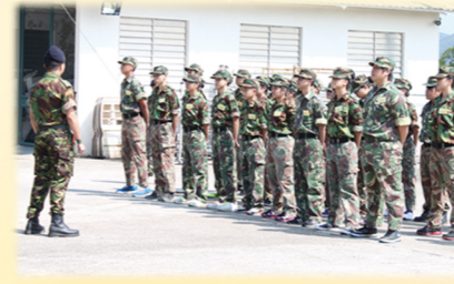
多元智能躍進計畫