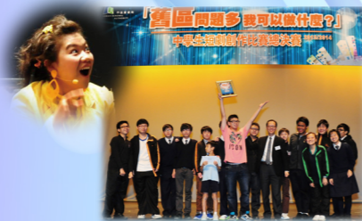
《深水埗的叉情尋》成功晉身總決賽， 獲得「最高人氣獎」及「最佳女演員」。